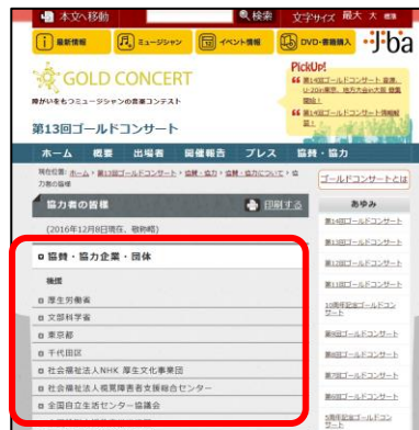
⑬ 当法人ホームページへの法人名の掲載・リンク