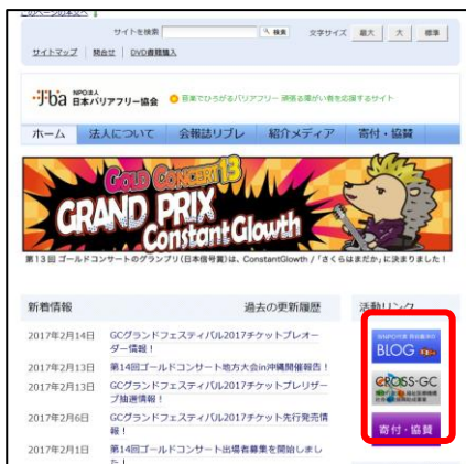
⑭ 当法人ホームページトップ画面へのバナー掲載・リンク(2口以上)